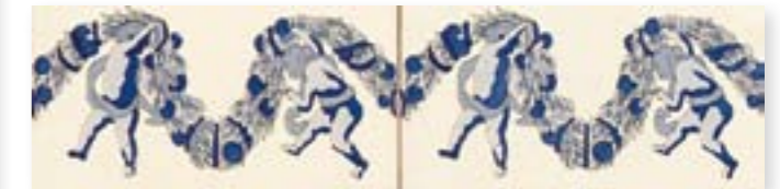
ADAN3009 - ADP25 CENEFA ALEGORIA AZUL 10 X 20 CM