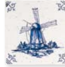
ADRU6002 - ADP53 DIBUJO DELFT Nº 1 C/ CANTONERA 13 x 13 cm.