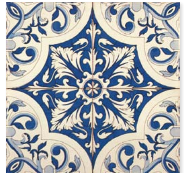
ADAN6008 - ADM27 DECORADO CHATEAU 20 X 20 cm.