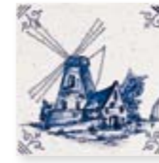
ADRU6003 - ADP53 DIBUJO DELFT Nº 2 C/ CANTONERA 13 x 13 cm.