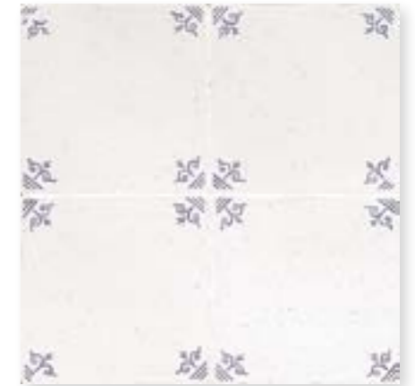
ADRU6001 - ADM22 CANTONERA DELFT 13 x 13 cm.