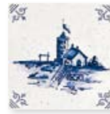
ADRU6004 - ADP53 DIBUJO DELFT Nº3 C/ CANTONERA 13 x 13 cm.