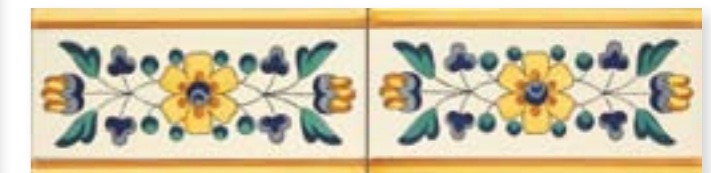
ADBA3025 - ADP25 CENEFA MAESTRAZGO 10 x 20 cm