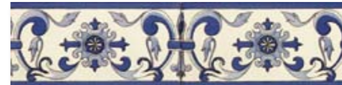
ADAN3017 - ADP25 CENEFA CHATEAU AZUL 10 X 20 CM