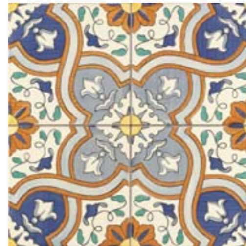
ADBA6010 - ADM30 DECORADO SERRANOS 15 x 15 cm.