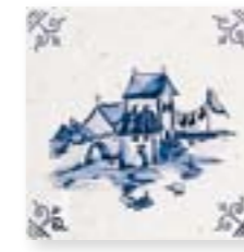
ADRU6005 - ADP53 DIBUJO DELFT Nº4 C/ CANTONERA 13 x 13 cm.