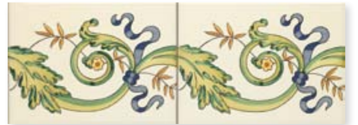
ADBA3030 - ADP34 CENEFA MORVEDRE 15 X 20 CM