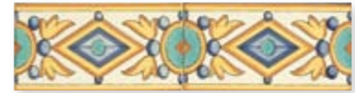
ADBA3027 - ADP20 CENEFA MIJARES 7,5 X 15 CM