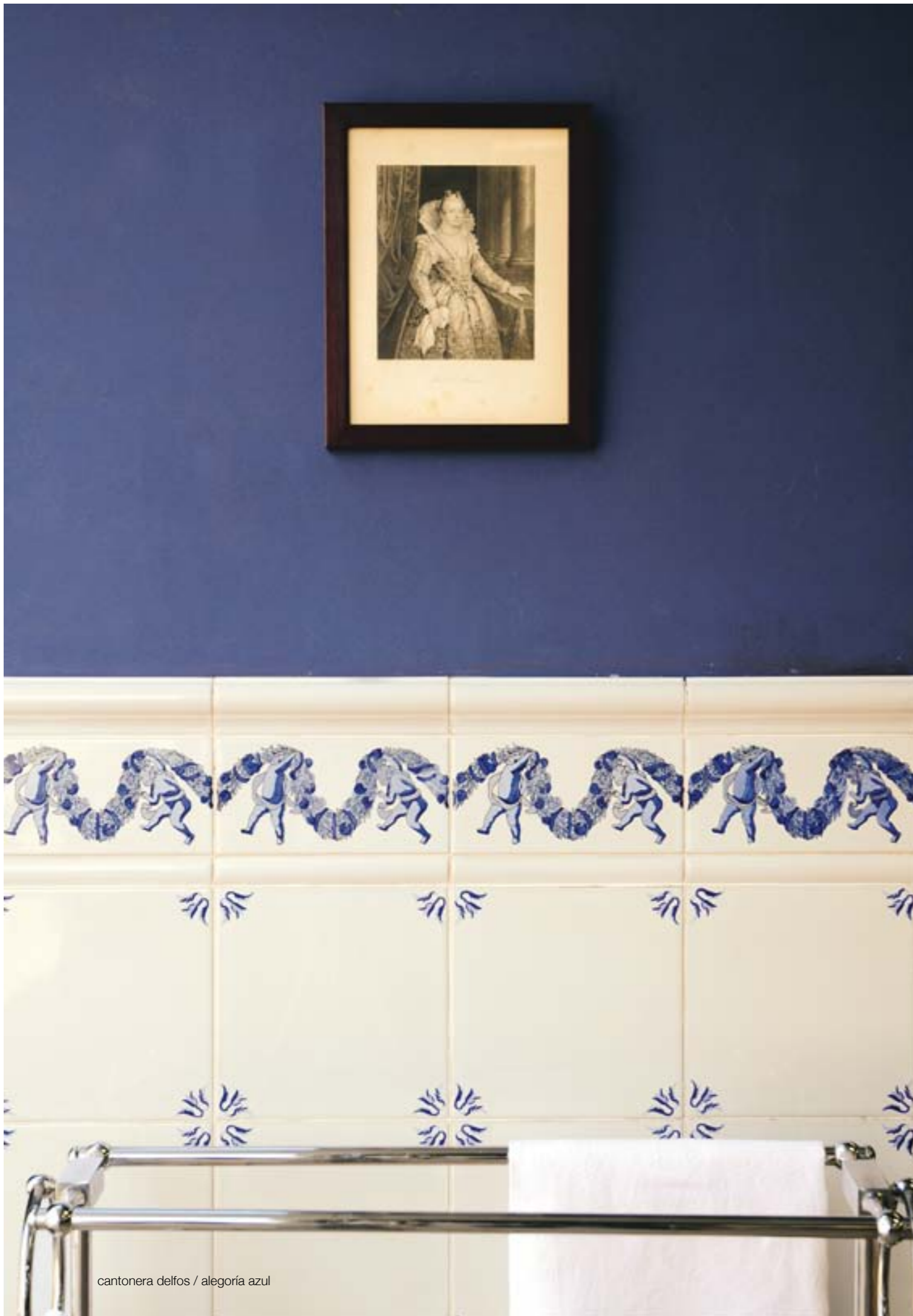
cantonera delfos / alegoría azul